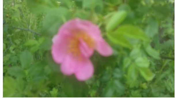
Rose selvatiche che sopravvivono e fioriscono.